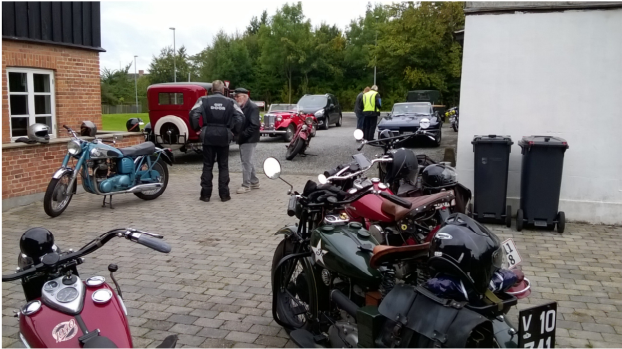
Heldigvis dukkede der lidt flere op til deltagelse i fællesturen...