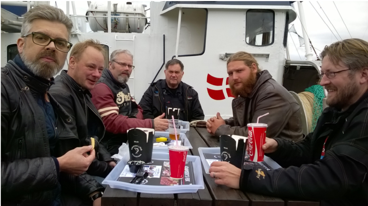
... hvor vi indtog frokosten, inden vi i sluttet kreds drog tilbage til Mårum, hvor aftenen dog kunne præstere lidt flere deltagere end om fredagen.