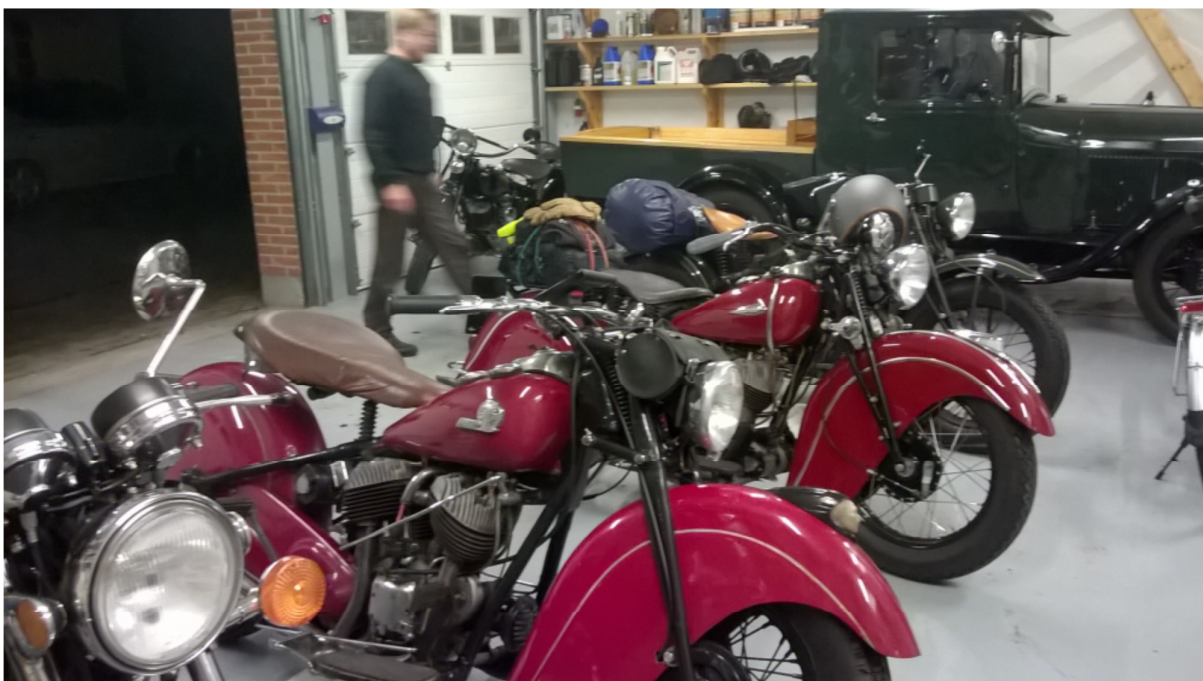
... så der var god plads i garagen.