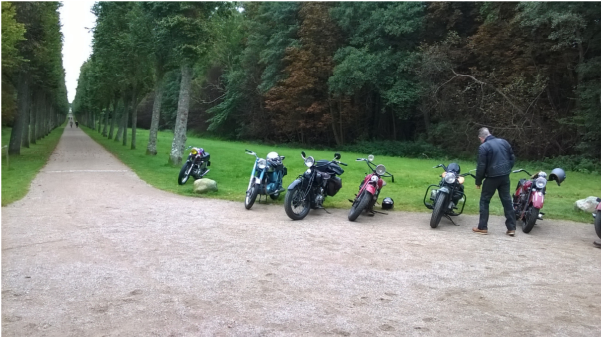
Her et stop i Fredensborg slotspark...