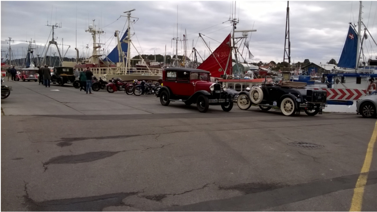
Fællesturen endemål blev, igen i år, Gilleleje Havn...