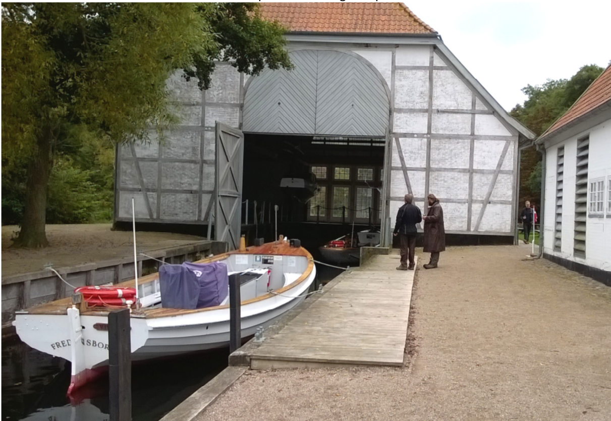
... hvor vi bl.a. så Prins Henriks lille motorbåd "hængt til tørre" i bådhuset.