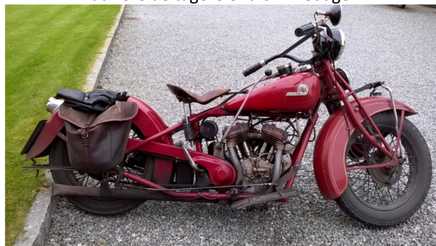
Carstens trofaste gangster.