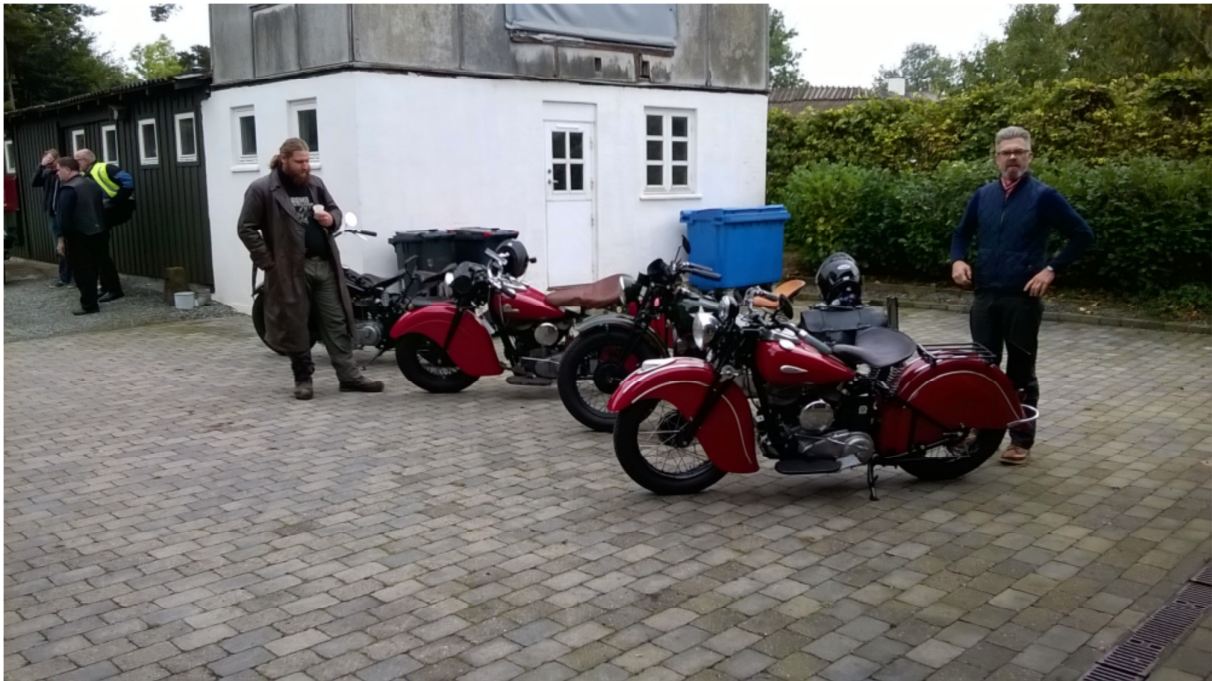
... blandt andre Carsten fra Sjælland, så kortegen kom til at bestå af 12 køretøjer.